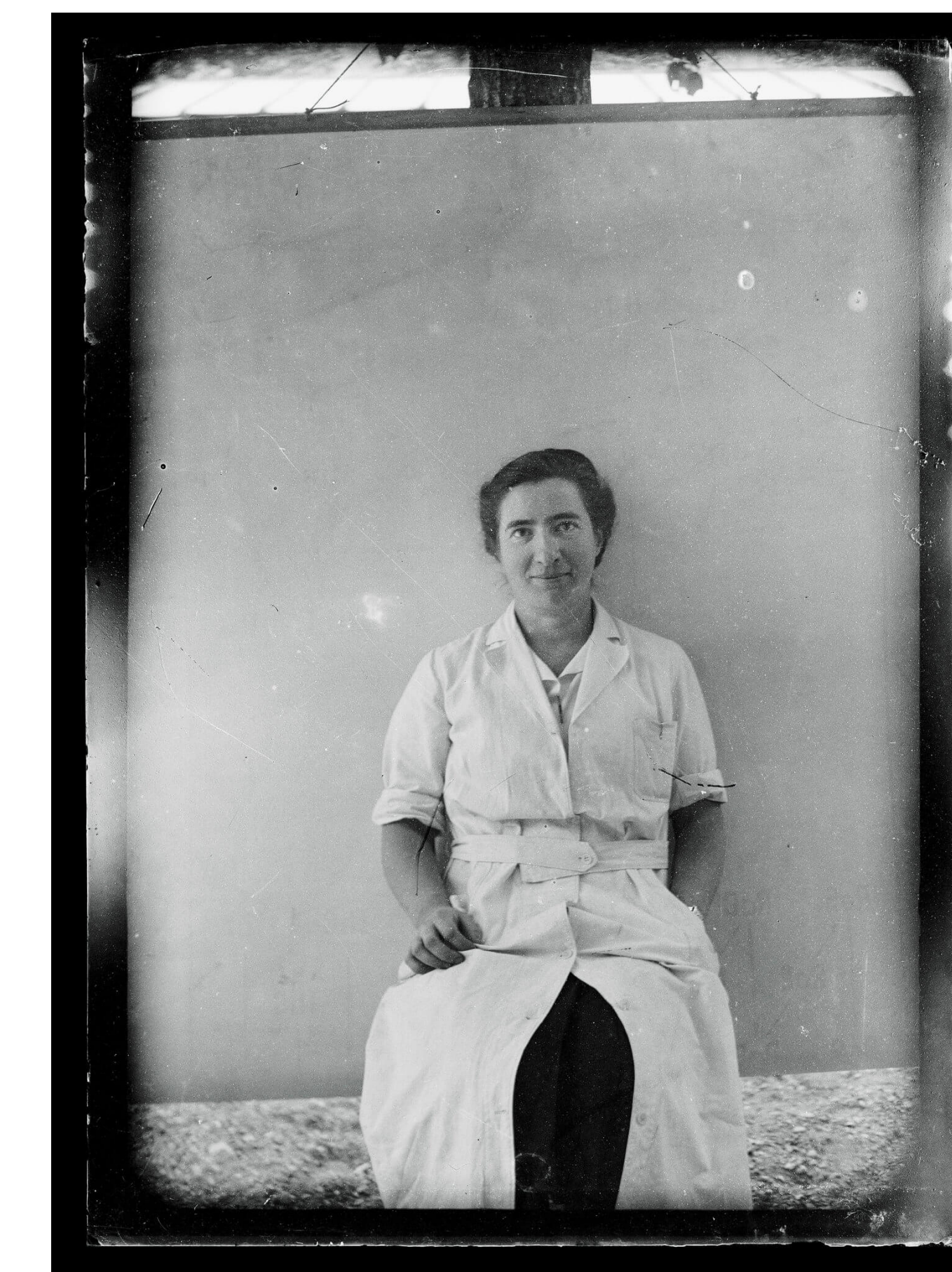
Marguerite Perey en 1938.

Perey realizó su gran aporte a la historia de la ciencia, el descubrimiento del francio, siendo ayudante de laboratorio. Sin duda, una clara muestra da la importancia del personal técnico que trabaja en los laboratorios, cuya labor pasa muchas veces desapercibida. Tras su gran descubrimiento, Marguerite no dejó de trabajar y formarse, ya que no tenía formación universitaria. Finalmente la consiguió y en 1946 defendió su tesis doctoral sobre el actinio K, donde proponía el nombre de francio para el nuevo elemento. Tres años después, la ya doctora Perey obtuvo una cátedra de Química Nuclear en la Universidad de Estrasburgo. Aunque estuvo nominada, no logró obtener el Premio Nobel, si bien consiguió otros galardones como la Medalla Lavoisier de la Sociedad Química Francesa.